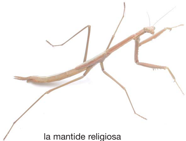
la mantide religiosa