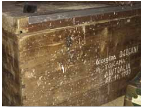
Trunk belonging to the Dereani family